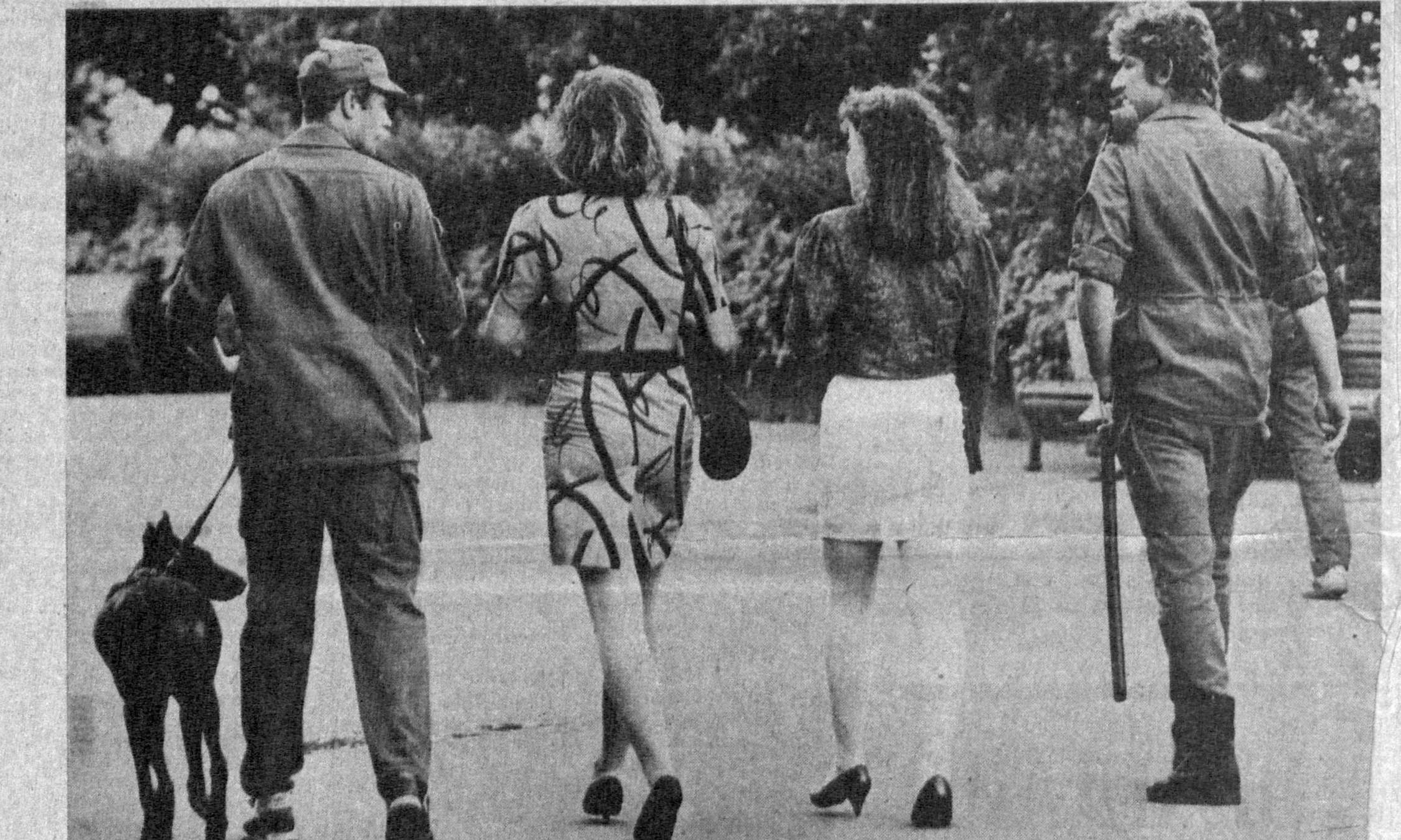
— Қўрқмайсанми? Кузатиб қўйсак... Бундай илтифотдан қизлар хурсанд бўлишар, балки. Яхшида, ёшларда шундай айлантиқ йигитлар юрса, беҳаттарроқ. Аслида ҳозирча хийбонлар, кучалар махсус қўриқчилари — ОМОНЧИЛАРИНИНГ вазифаси, бурчи бу. Баъзан қилган хизматлари учун тақдирланишади ҳам. Аммо кимдан, нимадан хавфсираш керак? Қўриқчи — нитга қаратилган? Буни иснонқ. Ҳарқалай оракда ҳақиди йўқ, хотиржам куларининг байрам. Кўнгиллар ёзилиб ҳордиқ чиқариш учун тапш буюриладиган масканларда эҳтиёт чоралари — буй тусдаги одамлар юраркан, байрам татиринмак?