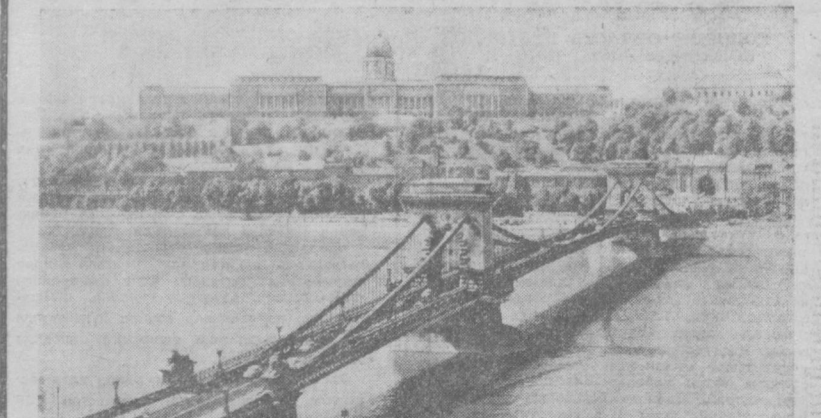
Суратда: Венгрия пойтахти Будапешт манзарасидан бир кўриниш.

Қабул қилинган аҳдиномага мувофиқ, Тошкентдаги МХР Бош консулхонасининг консулини округига Ўзбекистон, Қозғистон ва Қирғизистон ССРнинг айрим областлари, шунингдек РСФСРнинг бир қатча областлари кирди.