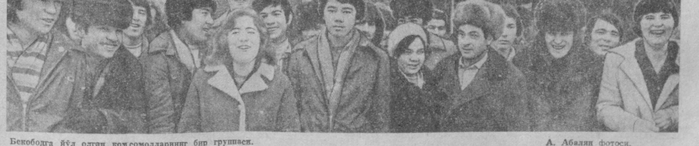
Бекободда йўл олган комсомолларнинг бир гуруҳи.

Бекободда йўл олган комсомолларнинг бир гуруҳи.