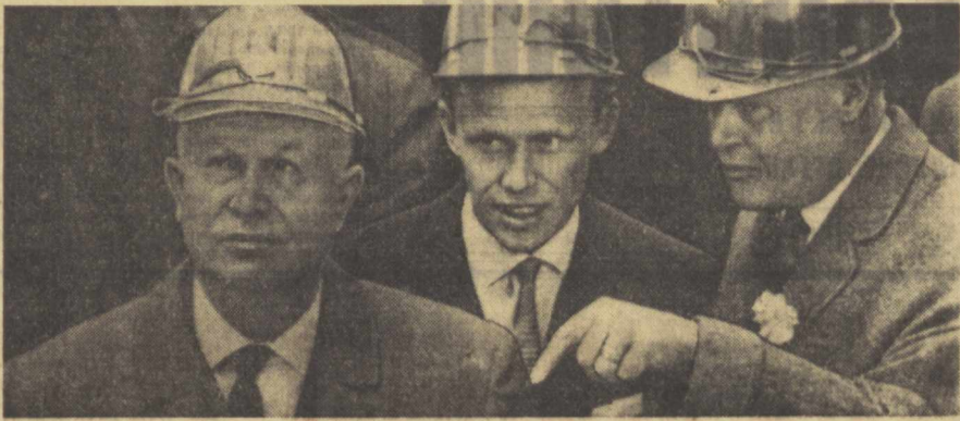
СССР Министрлар Советининг Раиси Н. С. Хрущев ва унинг ҳамроҳлари Гетеборгда. Суратда: Т. Эрландер хузурида бўлиб. Суратда: Н. С. Хрущев ва Т. Эрландер суҳбати пайти.

Н. С. ХРУЩЕВ: Мамлакатларимиз ўртасида кўпдан буён иқтисодий алоқалар мавжуд. Биз Швеция савдо-саноат аҳли билан совет савдо ва хўжалик ташкилотлари ўртасидаги алоқаларни табриклиймиз ҳамда бундай ўзаро манфаатли алоқаларни бундан буён ҳам ривожлантиришга тайёرمىз.