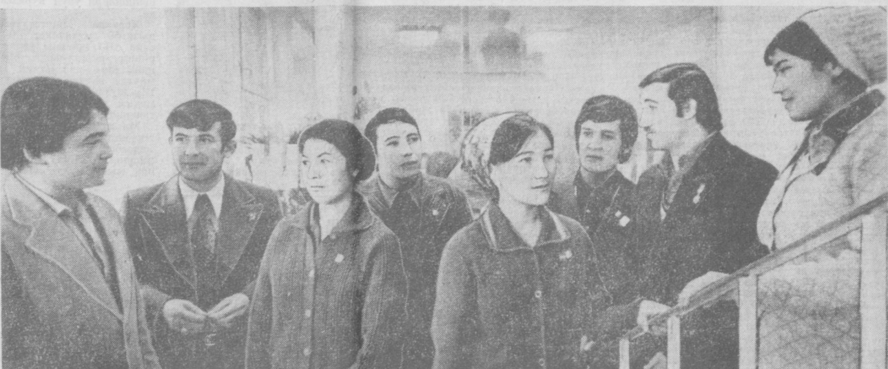
СУРАТДА: область комсомол конференцияси делегатларидан бир гушаси.

Ленин комсомоли катта ва унутилмас воқеалар арасида турибди. Комсомол ўзининг наватбати XVIII съезди томон келмоқда. Съезд ва Ленин комсомоли ташкил топган кўннинг 60 йиллик шарафига бошланган меҳнат мусобақаси тобора кенг кўроқ ёвверсин. Бу мусобақада юбилей йили ижтимоийликни сақлаб қолайлик ва мустақамлайлик, зарбдор иккини янги зафарлар билан нишонлашга бутун куч ва билмаларимизни сафарбар этайлик.