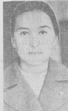
Биз фан-техника революцияси асрида яшаймиз. Бу дедик, ҳар бир студент...