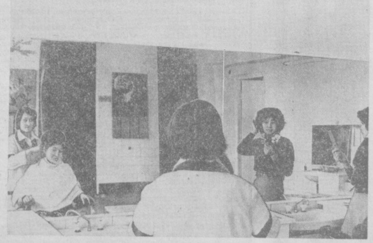
Янгиқўл район маркази Гулбаҳорда маъшият хизмат уйи иш бошлади. Ҳозирча бу ерда модалар ателъеси, аёллар ва эркаклар сартарошхонаси, фотостудия ва турли устаконалар ишлаб турибди.