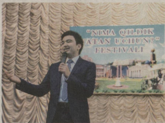
Учун ҳеч нарсани аямайдиган юрт — Ўзбекистон фарзанди эканимдан чексиз гурурланганман.

Ўзбекистон Республикаси Маданият ва спорт ишлари вазирлиги, «Ўзбекнаво» эстрада бирлашмаси ҳамда Андижон вилояти ҳокимлиги ҳамкорлигида ташкил этилган тадбирда таниқли ёзувчи ва шоирлар, маданият ва санъат намояндалари, талаба-ёшлар иштирок этди.