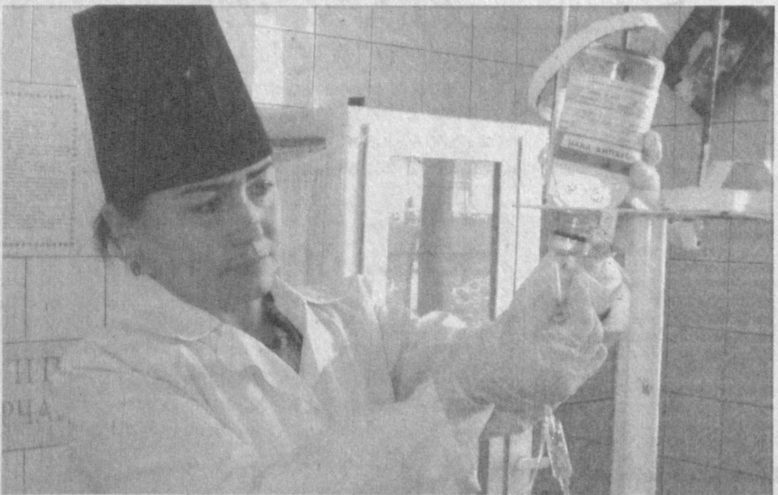
Булакбашинский районный отдел здравоохранения обслуживает 108 тысяч человек. В ведении райздраводела - две больницы, три поликлиники, 22 сельских врачебных пункта и родильный комплекс на 110 коек. В центральной районной больнице есть отделение скорой медицинской помощи на 20 коек и пять его подразделений в кишлаках.