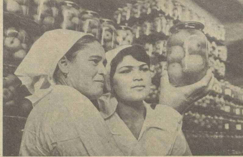
Янгиўл консерва заводи коллективи «Етиштирилган барча сазавот ва мева ҳосилини қайта ишлаш ва сақлашни» шпори остида меҳнат қилаётган. Улар ақунда йилда 50 хилдаги 86

Қўнчағов областдаги Оринбалик ва Чистополь районларидаги парралдилик фабрикалари, парралдилик бирлашмаларининг фермалари, сут ва бурдоқчилик комплексларининг энергия билан таъминлашни янги, 110-электр узатиш линияси анча яхшилади. 50 километр узунликдаги юқори вольтли магистрал мамлакатнинг ягона энергетика системасига уланди.