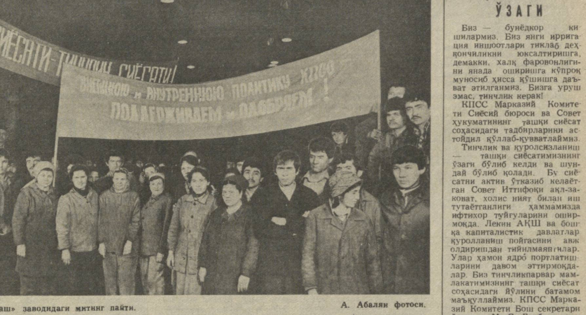
Суратда: «Ўзбексельмаш» заводидagi митинг лойти.

ҲАММАНИНГ, ҲАР БИР КИШИНИНГ ИШИ «Тинчликни сақлаш ҳақида, инсониятнинг ядро уруши хавфидан ҳалос этиш ҳақида гап борганида беғам ва бепарво кишилар бўлиши мумкин эмас, — деди КПСС Марказий Комитетининг Бош секретари ўртоқ М. С. Горбачев кунини кеча матбуотда эълон қилинган Баёнотида.— Бу — ҳамманинг ва ҳар бир кишининг ишидир».