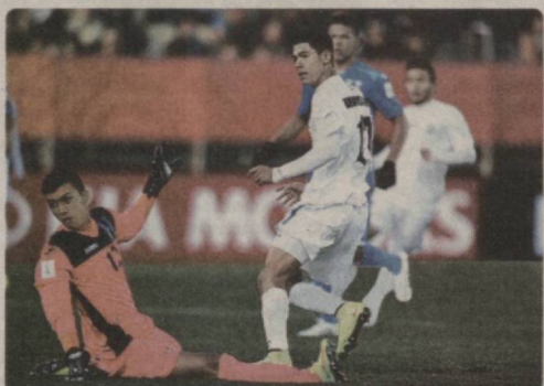
Суратда: Ўзбекистон — Гондурас ёшлар терма жамоалари баҳсидан лавҳа.