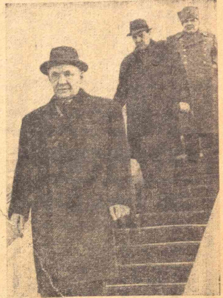
СССР Министрлар Совети Раиси А. Н. Косигин Тошкентга келиши. Суратда: Тошкент аэро- портда (чапдан) А. Н. Косигин, СССР ташқи иш- лар министри А. А. Громино ва СССР мудофаа министри Р. Я. Малиновский, В. Егоров ва А. Горюхин.

(КПСС Марказий Комитети, СССР Олий Совети Президиуми, СССР Министрлар Советининг совет халқига янги йил табригидан).