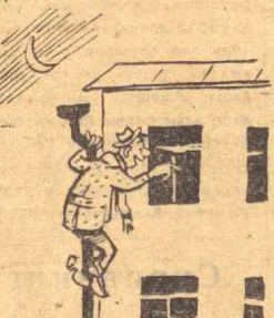
Ниҳоят уйимнинг деразасини топиб олдим-а.