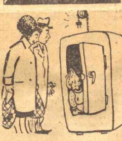
— Бунинг ичиде нима қилиб юрибсан? — Корбобони қидириб кирган эдим.