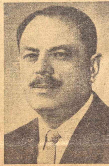
ПОКИСТОН ПРЕЗИДЕНТИ МУҲАММАД АЮБХОН

Лаъл Баҳодир Шастри 1904 йил 2 октябрда Мугхалас- ор (Уттар Прадеш штати) шаҳарчасида ўқитувчи оиласида туғилди. У Банорас университетига таъ- лим олди. Лаъл Баҳодир Шастри Ҳинд халқининг миллий озодлик ҳаракатида фаол қатнашди, бунинг учун негиз муаммакани ҳужумдорли томонидан бир неча марта қамоққа олинди. Махатма Гандини 1940 йили Жавоҳарлал Не- рунинг сафдоши бўлган Лаъл Баҳодир Шастри 1940 йили 2 октябрда Мугхаласор (Уттар Прадеш штати) шаҳарчасида ўқитувчи оиласида туғилди. Лаъл Баҳодир Шастри Ҳинд халқининг миллий озодлик ҳаракатида фаол қатнашди, бунинг учун негиз муаммакани ҳужумдорли томонидан бир неча марта қамоққа олинди. Махатма Гандини 1940 йили Жавоҳарлал Не- рунинг сафдоши бўлган Лаъл Баҳодир Шастри 1940 йили 2 октябрда Мугхаласор (Уттар Прадеш штати) шаҳарчасида ўқитувчи оиласида туғилди. Лаъл Баҳодир Шастри Ҳинд халқининг миллий озодлик ҳаракатида фаол қатнашди, бунинг учун негиз муаммакани ҳужумдорли томонидан бир неча марта қамоққа олинди.