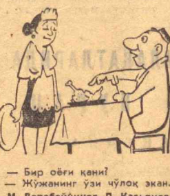
— Бир обғи қени! — Жужанинг ўзи чўлок экан. М. Робейичинов, П. Насыёнов ва А. Холитов чизган расмлар.