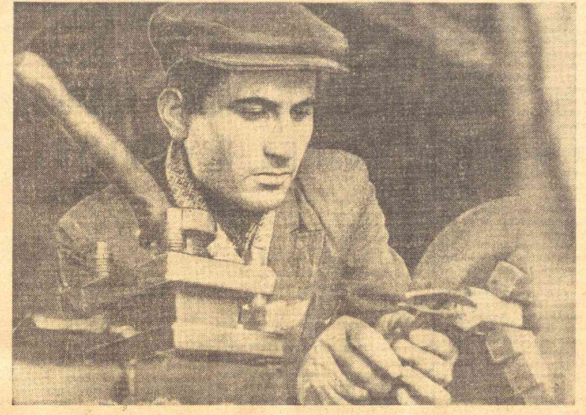
Хоразм вилояти, Янгиерлик районидagi «Победа» колхози устaxonасида иш қилгани. Механизаторлар ремонт ишларини ушoқoқли билан давом эттирмоқдалар.

Мамлакатнинг Узоқ Шарқ қисмида ўсувчи лимоннинг ажойиб хусусияти бор.