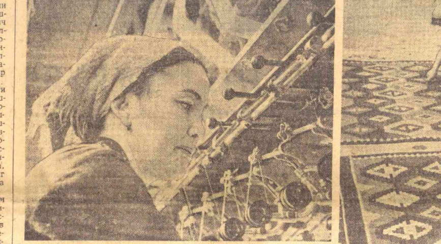
Тошкентдаги пиллакашлик фабрикаси коллективи москвалик ва ташаббусига қўшилиб...