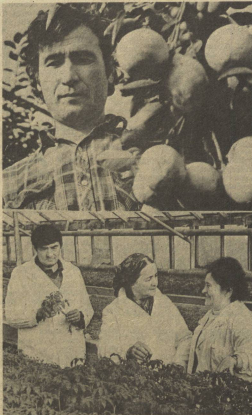
ТОШКЕНТ. Калинин районидаги «Партия XX съезди» колхози деҳқонлари шаҳарликлар дестурхонга қозғириб қиш кунларда ҳам қўлаб сабзаот ва мева маҳсулотлари етказиб бермоқдалар. Суратларда: (юқоридан) хў

улуқлиги ва тартибини мустақамлаш, интенсивлаш омилиларидан ва ички резервлардан фойдаланиш, меҳнатни ташкил этиш ва рағбатлантириш системасини такомиллаштириш, ресурсларни иқтисод қилиш ва тежамкорлик режимида кўчайтириш, рационализиш, тароққ ва иқтидорлигини ривожлантириш асосида халқ хўжалиги барча тароққларининг муттасил бир маромада ишлаши таъминланади. Йиллик план муддатидан аввал, 1987 йилнинг 24 декабрда, саноат маҳсулотини ишлаб чиқариш ва реализация қилиш юзасидан беш йилликнинг 4,5 йили учун