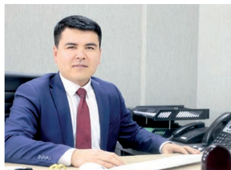
Баҳриддин АҲАТҚУЛОВ, Ўзбекистон Республикаси Қишлоқ хўжалиги вазирининг ёрдамчиси.

Биологик назоратта маҳсулот етиштириш, сифатини яхшилаш ва ҳосилдорликни ошириш билан бир вақтда эришилади. Зараркунандаларга қарши биологик курашда экологик тоза усулдан фойдаланиб, инсонлар соғлиғига хавф солмасдан шунингдек, табиатга зарар етказмасдан ҳимоя қилиш назарда тутилади.