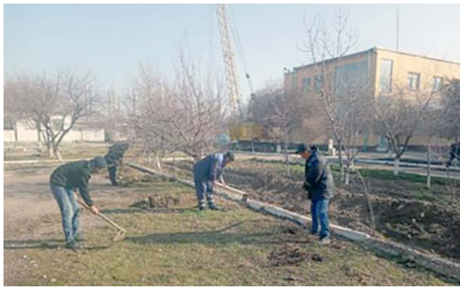
лантирилди. Ташкилотлар атрофлари тозаланиб, даракт ва буталар оқланди.

Ҳашарда тизимнинг 1700 нафардан ортиқ ишчи-ҳодимлари иштирок этди. 15 минг туп даракт ва гул кўчатлари экилди, 20 мингдан ортиқ дарактларга шакл берилиб, оқланди. Катта миқдордаги чиқиндилар тўплаб, зарарсиз-