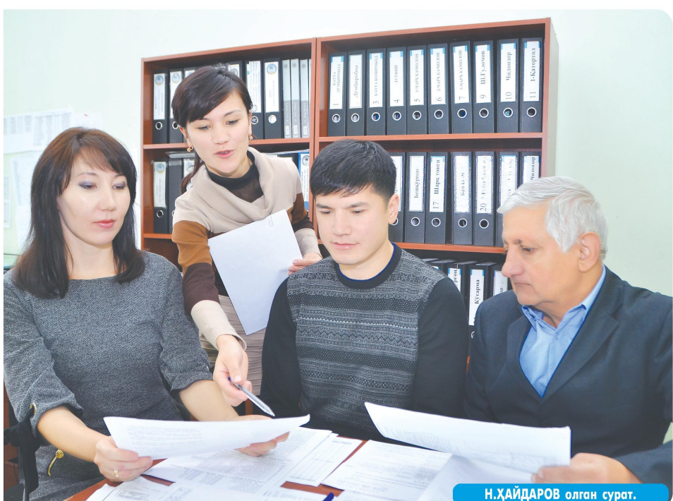
Н.ҲАЙДАРОВ олган сурат.

Юртбошимиз «Биз келажакимизни ўз қўлимиз билан қурашимиз» номли асариди: «Маҳалла, таъбир жоиз бўлса, кишилик жамиятида алоҳида тарбиявий аҳамиятга молик бўлган ўзига хос маскандир дейиш мумкин. Бу ноёб тажриба аҳолининг маҳалла бўлиб яшаш тарзи жаҳоннинг бошқа мамлакатларида кам учрайди. Шунинг учун ҳам инсонни жамият билан бирга яшашга ўргатадиган, шу руҳда тарбиялайдиган бирламчи ва беқиёс макон — бу маҳалладир» деб таъкидлайди.