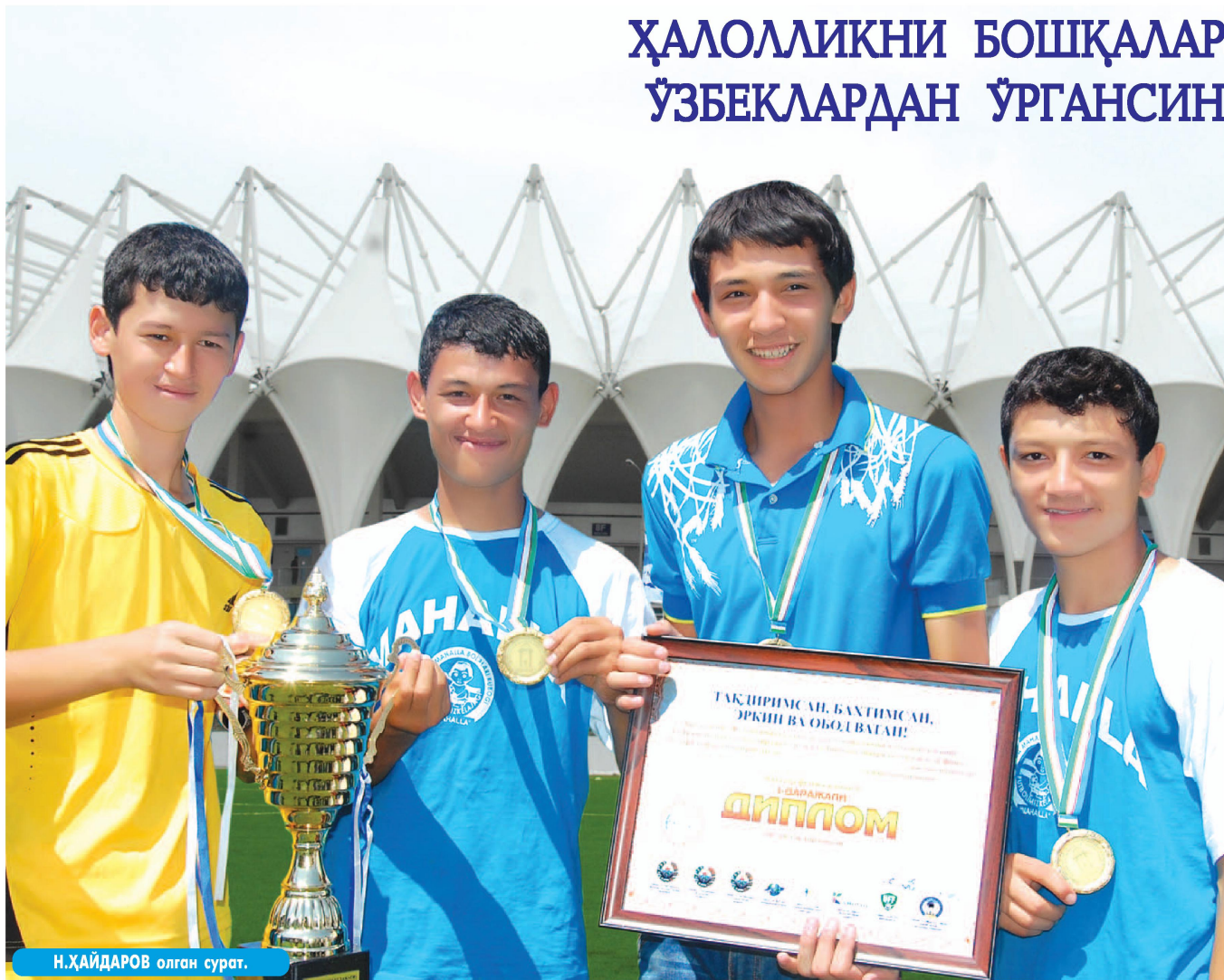
Н.ҲАЙДАРОВ олган сурат.