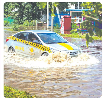
Маълумотларга қараганда, Хабаровск туманида Амурнинг сатҳи сўнгги 24 соатда етти сантиметрга пасайиб, саккиз метр-

Россиянинг Узоқ шарқ минтақасида сув тошқинлари ҳамон давом этмоқда.