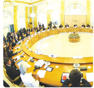
Саноати тараққий этган давлатларни ўз ичига оловчи «Катта йигирма-

Санкт-Петербургда «Катта йигирмалик»нинг навбатдаги саммити бўлиб ўтди.