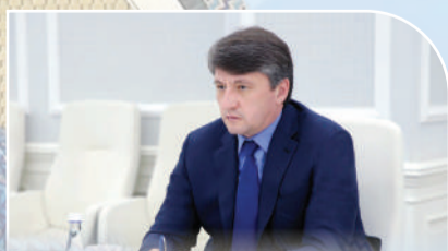
ТОШКЕНТ ШАҲРИГА ҲОКИМ ТАЙИНЛАНДИ