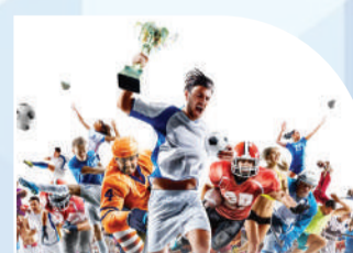
ТИМСОЛГА АЙЛАНГАН ҚАРАМА-ҚАРШИЛИКЛАР