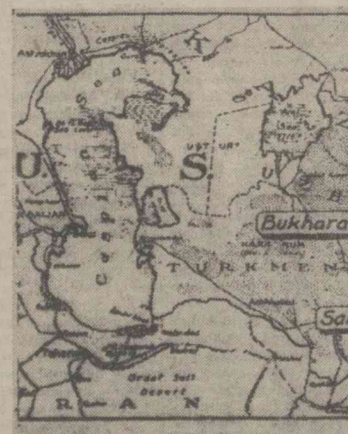
Карта с указанием городов, которые посетил корреспондент.

БУХОРО — қадимий бой маданияти билан фахрланса арзийди. Бугунги Бухоро — кейинги ўн йилларда чўлдан