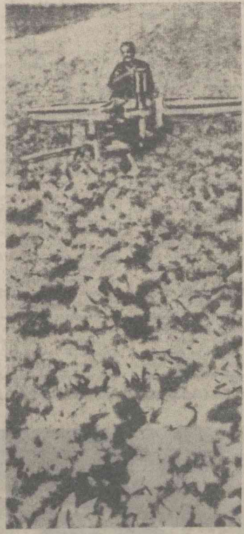
Маланали механизатор — совхозда энг обрўли касб.

Тошкентдан 70 километр жануборда Сирдарёни кесиб ўтган Яўдан Самарқандга борилди. Қадимги вақтда Исломнинг Зулқарнайи жангчиларига ҳам бу дарё Яқарт номи билан маълум эди. Уйдан чарпоқда Қишлоқ чўлига бораверишда ўт-ўлашлар ва гилёлар ўсиб ётган даст кўзга ташланади. Бу ерда бурларнинг улиши, тулкиларнинг, тўғизларнинг хириллаши эшитилади.