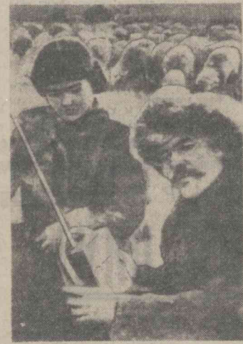
Ўзбек чўли ва унинг ўгли радиодан Тошкент янгиликларини эшитмоқдалар.

Москвада уй бекалари қор қутишиб, уйлариинг деразаларини пахта ва сирак билан бериктаётган эдилар. Урта Осиёда эса шу пайт ўзбек, қозоқ ва туркман деҳқонлари кенг далаларда «оқ олтин» ҳосили олиш учун гайрат билан меҳнат қилишарди.