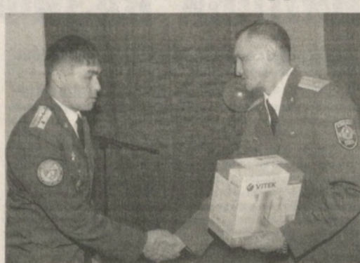
Давром АХМАД олган суратлар.

Ўқув юртлигари кириши учун катор имтиёзлар белгилангани ҳам барча ота-оналарнинг кўнглидаги иш бўлди.