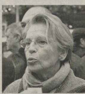
Интернет хабарлари асосида тайёрланди.

Оммавий ахборот воситалари бу бизнесчи Туниснинг тахтдан ағдарилган собиқ президенти Зин эл-Абидин Бен Алининг қариндоши эканлигини маълум қилди.