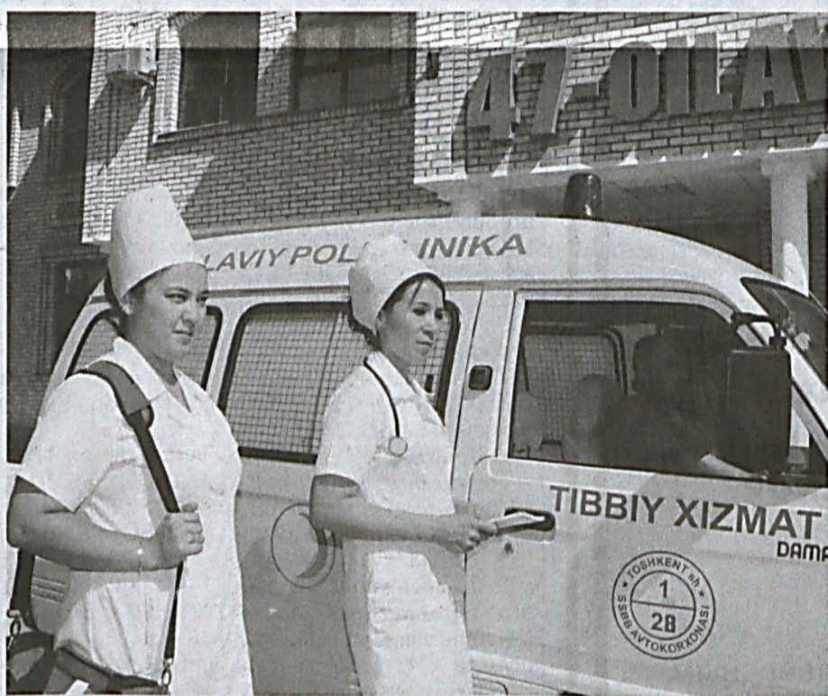
■ В семейной поликлинике № 47 Шайхантауровского района столицы действует подстанция скорой медицинской помощи с закрепленным автомобилем для посещения пациентов в экстренных ситуациях.

Не зря эта подстанция образована при поликлинике. Цель - сокращение дистанции при вызове "скорой" и ознакомление с амбулаторной картой пациента до приезда к его дому. Это дает возможность узнать о болезнях, лечении и другую информацию о здоровье. После посещения бригада предупреждает врача общей практики, впоследствии осуществляется плановый патронаж.