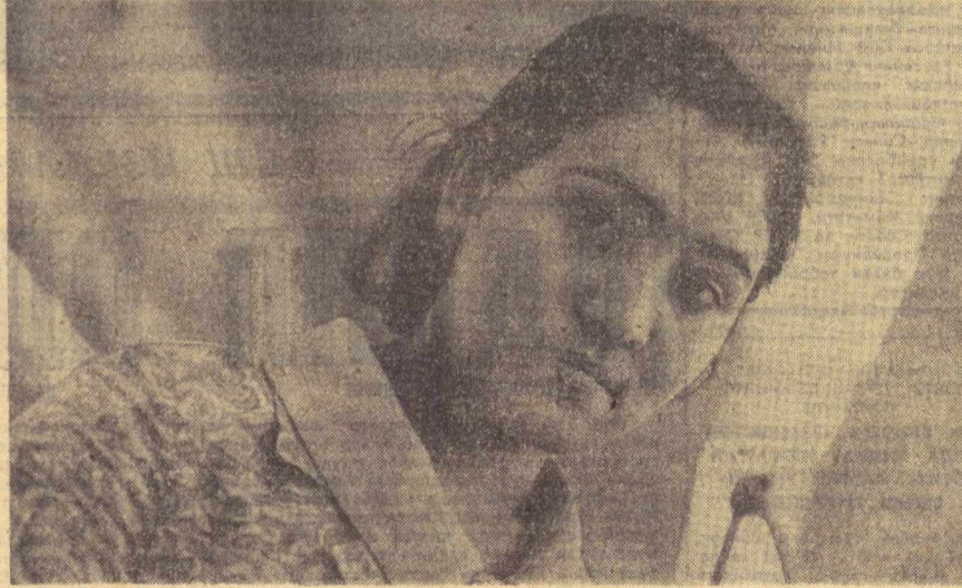
Пойтахтимиздаги «Қизил тоғ» тикувчилик фирмасининг коллективи КПСС XXIV съезди шарафига биринчи нартал планни муваффақият билан бажаришга аҳд қилди.