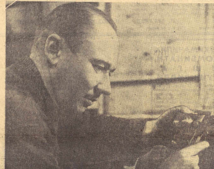
Ташкилот раҳбарлари ва делегация аъзолари билан суҳбат қилишда.