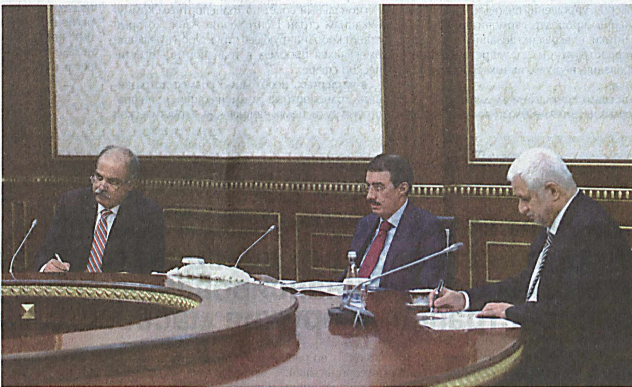
Президент Республики Узбекистан Шавкат Мирзиёев 20 сентября принял президента Исламского банка развития Бангара Хаджара, прибывшего в нашу страну во главе делегации ведущих арабских фондов Координационной группы.

Глава нашего государства, тепло приветствуя гостя, с глубоким удовлетворением отметил многолетнее плодотворное партнерство с Исламским банком развития в реализации приоритетных социально-экономических и культурно-гуманитарных программ в стране.