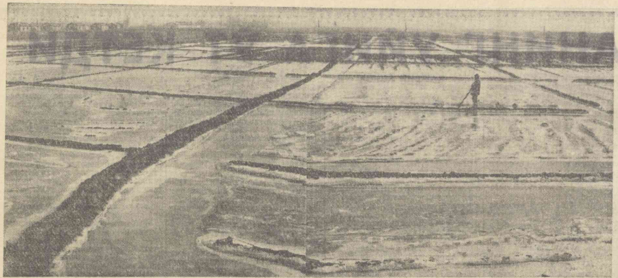
ОХУНБОБОВ районидagi Карл Маркс номи колхоз аъзолари бу йил ҳар гектар ердан 30 центнердан оқ олтин етиштиришга аҳд қилганлар. Марказий Фарғона ерларида бундай мўл ҳоли етиштириш осон эмас. Бунинг учун ерларнинг шўрлини яхшилаб ювиш керак. Суратда: колхозда шўр ювиш пайти.