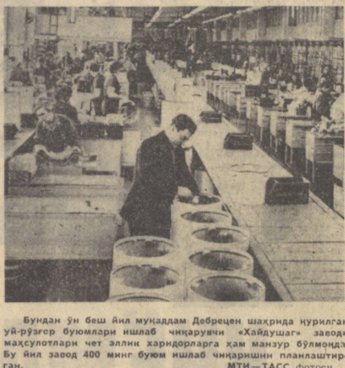
Бундан ўн беш йил муқаддам Дебрецен шаҳрида курилган уй-руҳроғ буюмлари ишлаб чиқарувчи «Хайдушэг» заводи маҳсулотлари чет элли ҳаридорларга ҳам манзур бўлмоқда. Бу йил завод 400 минг буюм ишлаб чиқаришни планлаштир­ган.