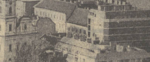
Дунай ўстадан ошиб ўтган кўпригининг пўлат ленталари шаҳарининг ҳар икки қисми—Буда ва Пештин халқат бир ша­ҳарга би­рлаш­ти­риб турибди.