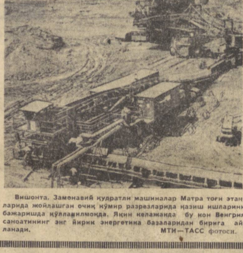
Вишонга. Заменавий кудратли машиналар Матра тоғи эта­лар­ида ижодланган оқиқ кўп­ми разваларида кизиш ишларини бақартириш қўлавланмоқда. Яқин келаянкада бу ион Венгрия саноатининг энг йирик эн­ер­гетика ба­за­ларидан би­рига ай­ланади.