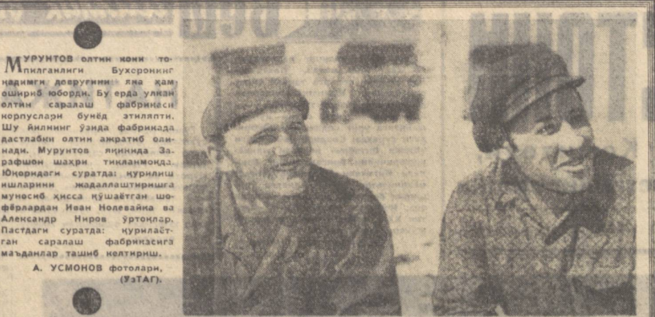
Мурунтов олтин қамин тоқилганлиги Бухоронинг қадимги довуғини яна ҳам ошириб юборди. Бу ерда уланган отани саралаш фабрикада дастлаб олтин акрилати олинади.

Хозирги вақтда Хоразм областидаги хотин-қизлар анжуманида саноат ва қишлоқ хўжалик ишлаб чиқаришининг неча минглаб новаторлари, врачлари, муаллимлари, бошқа касблардаги ходимлари бор.