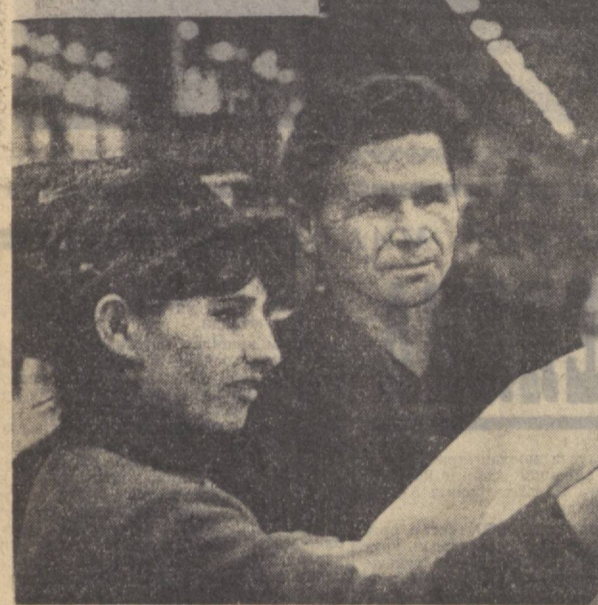
Маҳаллий советлар ва беш кунлик иш ҳафтаси

АҚШ президенти Жонсон Шимолдаги Вьетнам бомбардимон қилишларини қисман тўхтатиш тўғрисида шу йил 31 мартда бўйруқ берганлиги муносабати билан Вьетнам Демократик Республикасининг ҳукумати шу йил 3 апрелда баёнот чиқарди.