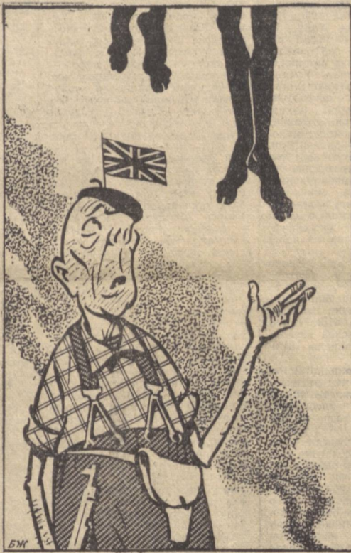
ИРҚЧИ: — Биз ўз сибатимизда барча факторларнинг муъозанатини синая кўраймиз. Рассом Б. ЖУКОВ чизган расм.

НЬЮ-ЙОРК, 5 апрель. (ТАСС). Нобель тинчлик мукофотининг лауреати, Америка негрларининг гражданлик ҳуқуқлари учун кураш ҳаракатининг раҳбари Мартин Лютер Кинг кеча Мемфисда (Теннесси штати) ирқчилар томонидан ўлдирildi.