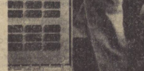
Меҳнатчилар депутатлари Каттақўрғон шаҳар Совети ижроия қўмитетининг раиси.

Украина курувчилари синалган ва мукамал усулга амал қилиб Тошкентда янги ўй-жой бинолари ва маданий-маиший объектлар курилишини тобора жадаллаштиришга муваффақ бўлмоқда.