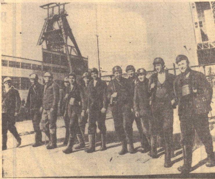
ПОЛЬША. Республика саноат корхоналарининг коллективлари Польша Бирлашган ишчи партиясининг VI съезди шарофига охирилган мажбуриятлар олимшода.