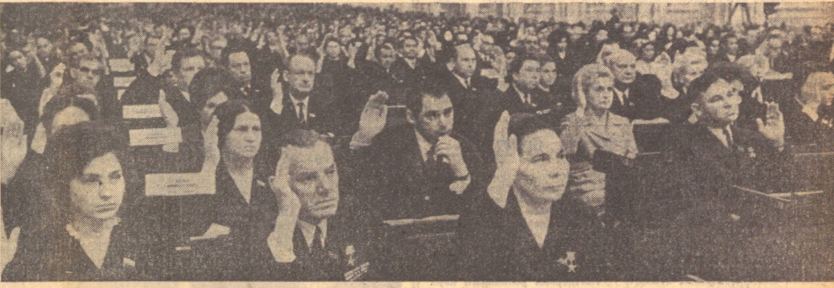
МОСКВА. Суратда: Катта Кремль саройида Иттифоқ Совети ва Миллатлар Советининг қўшма мажлиси. С. Смирнов ва А. Степанов фотоси, («ИЗВЕСТИЯ»).

лаштириш чораларини муҳофизат қилди. Соғлиқни сақлаш ва социал таъминот комиссияси депутатлар оғлининг ўтказган ишлари ва лойиҳаларининг санитариya аҳволини текшириш натижасини яқинда, Сирдарё областида шунинг комиссиясининг аҳолига яхтисолаштирилган медицина ёрдами кўраётганини ташкил этиш тўғрисидаги доклад ҳам тингладди. Комиссиялар кўриб чиқилган ҳамма масалалар юзасида тегишли тавсиялар қабул қилдилар. (ЎТАП).