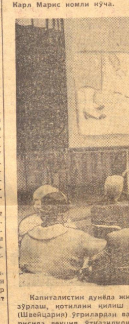
Болгария Халқ Республикаси тобора гуллаб-яшнамоқда. Суратда: Варна шаҳридаги Карл Маркс номи кўча.

Капиталист дунёда жиноятчилик кундан-кунга кучайиб кетмоқда. Уғирлик қилиш, зўрлаш, қотиллик қилиш оқдй бир вонгага айланиб қолди.