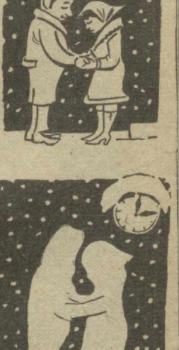
Янги йилни кутиб...