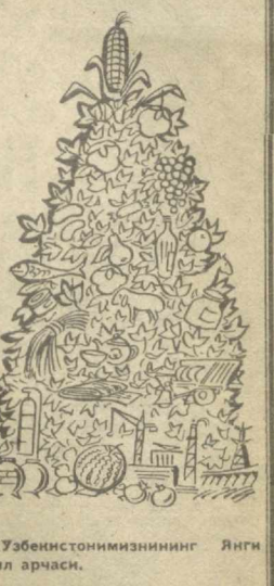
Ўзбекистонимизнинг Янги йил арчаси.

ЕТТИ ЕШЛАРДАГИ БОЛА тарвақайлаб ўсган дарахт тағида турибди. Эғинда почаси узун иштон, каттак қўйлагининг бир ени йиртилган. Бошида қатғирмаси чиқиб кетган бахмал дўши.