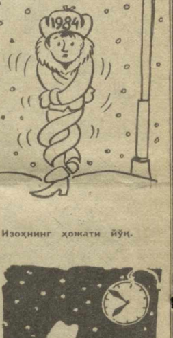
Изоҳнинг ҳолати йўқ.

— Суратга тушсанми? — у сиркан кичирларини пирпиратиб, таванхоҳа томонга қараб қўйди.