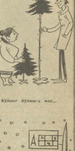
Бўйинг бўйимга мос...

Даста-даста суратларини қўздан кечирарканам, ўн йил нарига етти-саккиз йил бор болалигимга қайтиб қолгандек эдим. Мунча кўп болалар! Нимага энди ҳаммаси болаларнинг сурати?