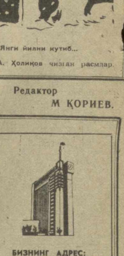
Янги йилни кутиб...