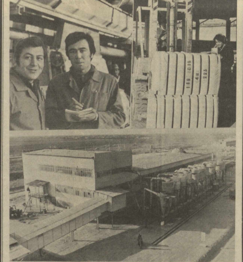
Қаршидаги «Целинстрой» трестининг курувчи ва монтажчилари яқинида «Жейнов» пахта тазалаш заводини фойдаланган билан куриб, айдо сифатлар билан куриб, алодаланишга топширган эдилар. Корхона йилга 30 миң тонна маҳсулот ишлаб чиқариш қувватига эга. Завод