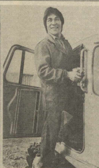
Янги йилнинг мўл ҳовили кўп имҳатдан техника воситаларининг унумли ишлатишга боғлиқ. Бунин қалбдан ҳис қилган «Госкомсельхозтехника»