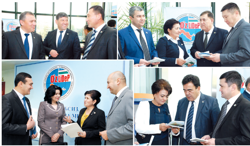
Солиқ ЗОИР олган суратлар

Авал хабар берганимиздек, ўтган ҳафтада Тadbirkorлар ва ишбилармонлар ҳаракати — Ўзбекистон Либерал-демократик партиясининг навбатдаги съезди бўлиб ўтди. Унда Ўзбекистон Республикаси Президенти Ислам Каримов қатнашди ва мамлакатимизда амалга оширилаётган кенг қўламли ислохотларнинг мазмун-моҳияти, турли жабҳаларда эришилаётган ютуқ ва марралар хусусида атрофлича маъруза қилди. Партияимизнинг яқин йиллардаги фаолияти учун ўзига хос дастуриламал бўлган мазкур маъруза кенг жамоатчиликда катта қизиқиш уйғотди. Съезд делегатлари томонидан билдирилган мулоҳазалар ҳам бу фикрни тасдиқлаб турибди.