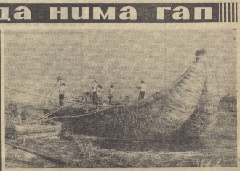
Норвегиллик машҳур олим ва сайёҳ Тур Хейердал бошим- лидаги интернационал эн- паининг «Тигрис» қанйиғидagi экспедицияси муваффақиятли

Польша металлургияси шу беш йилликнинг биринчи йилида 15,1 миллион тонна пулат эритган бўлса, бу йил улар халқ хўжалигига қандай 20,1 миллион тонна пулат бериш вазифа- сини ўз олдларига қўйди.