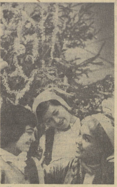
А. Тўраев фотодарди.