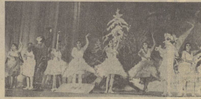
Суратларда: «Баҳор» ансамблининг концерт залида ўқувчилар арча байрами.

Митинг қатнашчилари қабул қилган резолюцияда АҚШнинг янги илвоғарлиги муносабати билан Совет ҳукуматиининг баёноти қизғин қўллаб-қувватланди. Вьетнамдаги ва бутун Хинди-Хитойдаги Америка қўшнилари олиб чиқиб кетилиши, деб талаб қилинди. (УзТАБ).