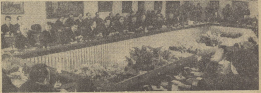
Прага, 25 январь. Варшава Шартномасида қатнашувчи давлатлар Сиёсий маслаҳат комитетининг кенгашида.