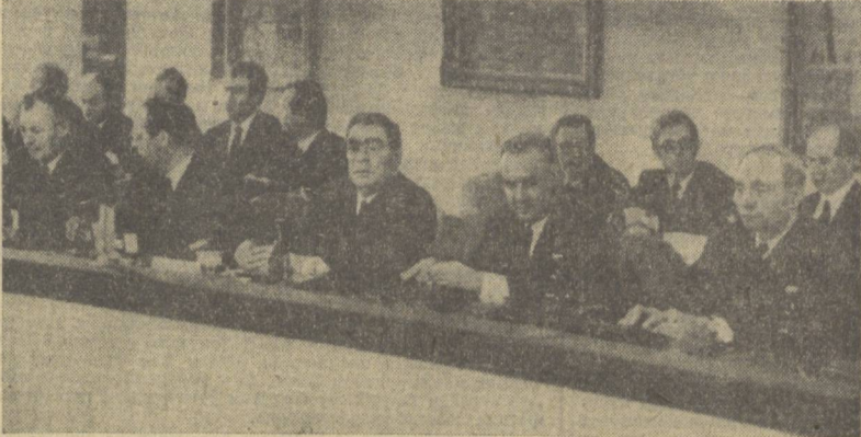
Прага, 25 январь. Варшава Шартномасида қатнашувчи давлатлар Сиёсий маслаҳат комитетининг кенгаши. Суратда: совет делегацияси кенгашида.

ГАЗЕТА 1918 ЙИЛ 21 ИЮНДАН ЧИКА БОШЛАГАН 27 январь 1972 йил, пайшанба № 22 (15.193). Баҳос 2 тийин.