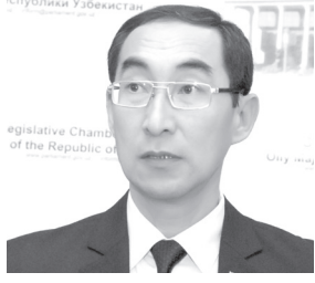
Тўлқин КАРИМОВ, Олий Мажлис Қонунчилик палатаси депутати, O'zLiDeP фракцияси аъзоси

Маълумки, Президентимизнинг Ўзбекистон Республикаси Давлат мустақиллигининг йигирма тўрт йиллик байрамга тайёргарлик кўриш ва уни ўтказиш бўйича қабул қилган қарориди бу йилги тантаналар «Бетакоримсан, ягонасан, она Ватаним — Ўзбекистоним!» деган эзгу ғояни ўзида мужассам этган шиор остида нишонланиши белгилаб берилди