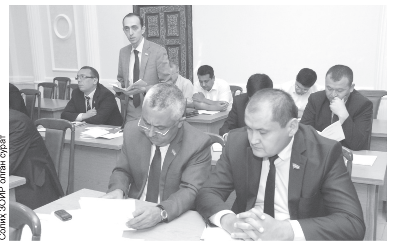
Сониқ ЗОИР олпан сураёт

O'zLiDeP фракциясининг навбатдаги ййгилишида «Жисмоний тарбия ва спорт тўғрисида»ги Ўзбекистон Республикаси Қонунига ўзгаришлар ва қўшимчалар киритиш ҳақида»ги қонун лойиҳаси биринчи ўқишда атрофлича муҳокама қилинди