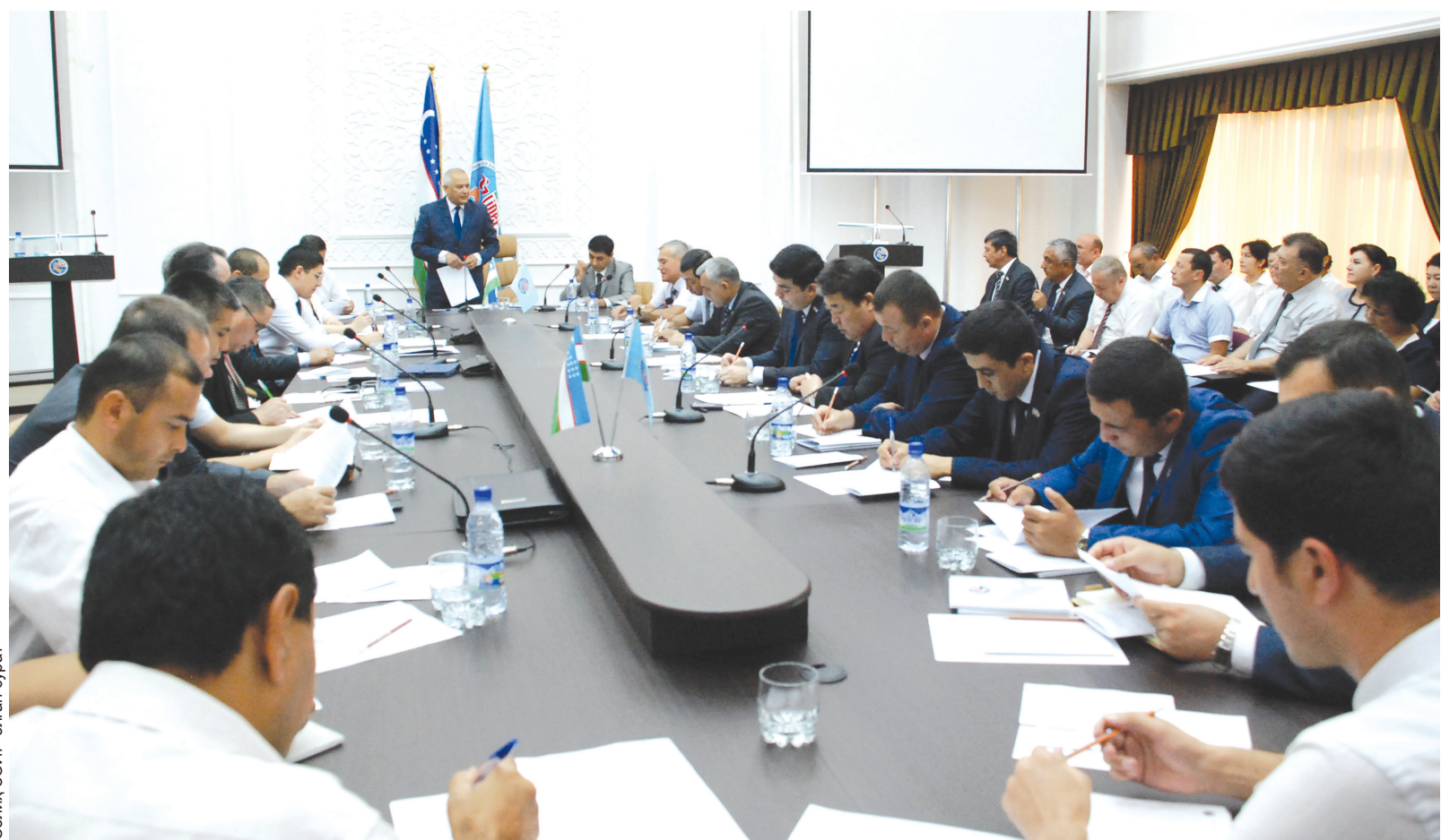
Соллик, ЗОИР отган сурат

Куни кеча О'zLiDeP Сиёсий Кенгаши Ижроия кўмитаси ҳамда Олий Мажлис Қонунчилик палатасидаги фракциясининг кенгайтирилган қўшма йиғилиши бўлиб ўтди. Унда Президентимизнинг 2015 йил 17 июлдаги «Ўзбекистон Республикаси давлат мустақиллигининг йигирма тўрт йиллик байрамига тайёргарлик кўриш ва уни ўтказиш тўғрисида»ги қарори ижроси юзасидан партия тузилмалари олдида турган долзарб вазифалар, жойларда амалга оширилаётган тарғибот тadbирларининг таъсирчанлигини таъминлаш хусусида атрофлича сўз юритилди