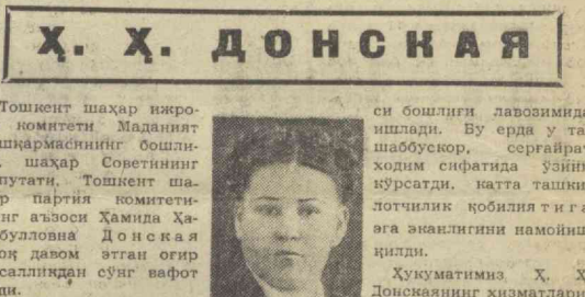
Х. Х. Донская 1913 йида Оренбург шаҳрида туғилган. Ушундан олдинда туғилган...