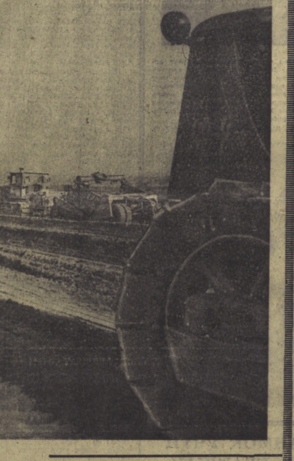
Р. АШУРОВ ФОТОСИ (У.ТАҒ).