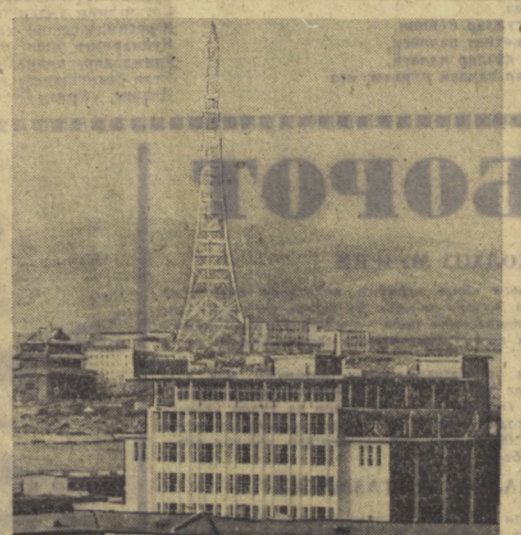
УЛАН-БАТОР. Мугулистон Халқ Республикасида янги телеви́он марказининг ишга туширилганига қарий бир йил бўлди. Телемарказ совет мутахассислари ёрдамида куралди. Суратда: телевизион минараининг кўриниши. В. Мачинов фотоси. (ТАСС.)

Янги йил бошлангунга қадар теплица майдонининг фаят бир қисминдан 1100 тоннадан ортиқ помидор узиб олинди. Бу йил ана шу «Витамин фабрикаси» анча кенгайтирилди. Яна 20 та хўжалик бирлаштириш теплица қуриш ва уларда сабазот етиштириш учун кооперативларро бириштириш истагини билдирди. (ТАСС.)