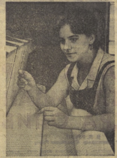
Тошкент тринотаж фирмаси ишчилари дохил В. И. Ленин туғилган кунининг 100 йиллигини...

қилди. У редакциянинг ватмосфера кўндалига ҳаёт бераётган эди. «Хурматли ўртоқлар!