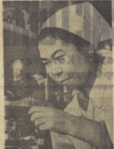
Янгийўл шаҳридаги кондитер фабрикаси химия лабораториясида махсуслат сифатини яхши...