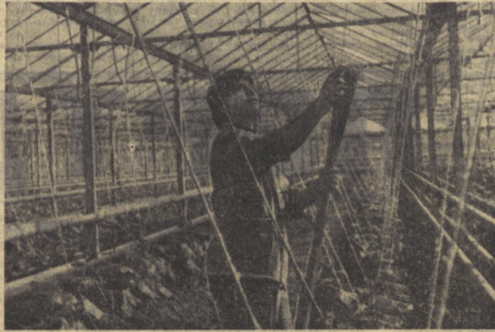
Болгарияда теплицалар йил сайин кенгайтирилмоқда. Су ратда: Стара Загора шаҳри яқинида қурилаётган теплицани кўриб туришда. Теплица 24 гектар майдонни эгаллайди.

Югославияда Белград — Бар темир йўли қурилишига катта аҳамият берилмоқда. Бу йўл магистрал пойтахтни Адриатика денгизи соҳилида яқинда ишга туширилган замонавий порт билан боғлайди.