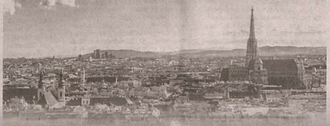
Австрия оммавий ахборот воситалари:

ни таъминлаш юзасидан конструктив таклифлар билдирилди. Жумладан, "Узгросервис" АЖ таркибига кирувчи машина-трактор паркларига қишлоқ ҳўжалиги техникасини етказиб бериш параметрларининг бажарилиши ҳамда техника паркинги янгилаш жараёнларини рағбатлантиришнинг амалдаги механизмларини тақомиллаштириш лозимлиги қайд этилди.