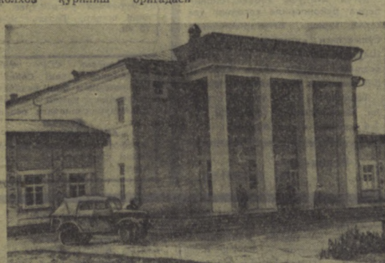
Суратда: колхоз клуби ҳамшира меҳнатнашлар билан гажвум. У маърифий, олимлар-синий ишлар марказига айланган.