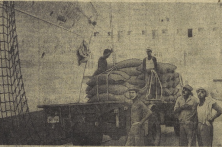
КУБА РЕСПУБЛИКАСИ. Гавана — портида Совет турбо-электростанцияси «Балтинга» шакар ортимида.