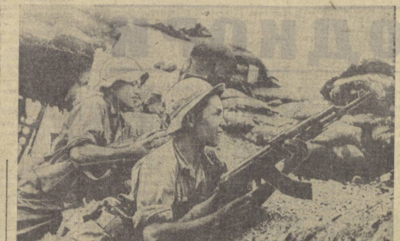
ЖАНУБИЙ ВЬЕТНАМ. Озодлик халқ қуролини кучлари Америка-Сайгон қўшилларининг позицияларига ҳужум қилишда давом этмоқдалар. Суратда: озодлик халқ қуролини кучларининг жангчилари душмандан тортиб олинган позицияда.

Т. Живков эътибор вақтида қалаҳ кўтариб, делегациялар ўртасида кўнгидагидек суҳбат қилинганлигини, ҳар икки партия ва мамлакат ўртасида, Болгария ва Куба халқлари ўртасида мавжуд бўлган ўртоқлик ва дўстлик муҳитидан гойа мамнун эканлигини айтди. Ф. Кастро ўзининг жавоб нутқида куйдагиларни таъкидлаб ўтди: ҳар иккала мамлакат партия-хукумат делегацияларининг суҳбатлари гойа фойдала ва катта аҳамиятга эга бўлди. Иқтисодий ва сиёсий масалалар юзасидан ҳар икки томоннинг берган ахборотлари янада кенроқ қўламада ҳамкорлик қилиш ва ҳамжихатлик учун имкониятлар яратиб беради.