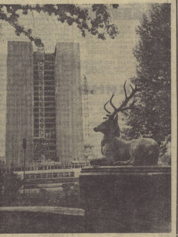
ТОШКЕНТ жамоли кундан-кун ортаётди. Янги-янги маъмурий ва маданий-маиший бинолар қад ростлантили. бу суратда Ленин номи майдонда қад кўтарилган 19 қаватли маъмурий бинони кўриб турибсиз.