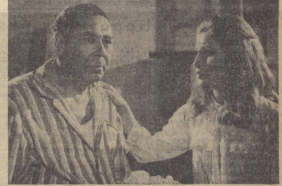
Фестиваль программасида кўрсатилган кинофильмлар муваффақиятли намоиш этилмоқда. Суратда Миср Араб Республикаси делегациясини олиб келган «Муҳаббат баҳоси» фильмининг надр.

Тошкент кинофестивалидан тик-ниқ таассуротлар билан қайтишимизга ишончимиз комил.