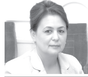
Одина ЖАМОЛДИНОВА, Олий Мажлис Қонунчилик палатаси депутаты, О'zLiDeP фракцияси аъзоси

Кейинги йилларда мамлакатимизда кенг қўламли ижтимоий-иқтисодий ислохотлар амалга оширилиб, ишбилармонлик фаолиятини қўллаб-қувватлашга йўналтирилган кўплаб қонунлар, фармон ва қарорлар қабул қилинди