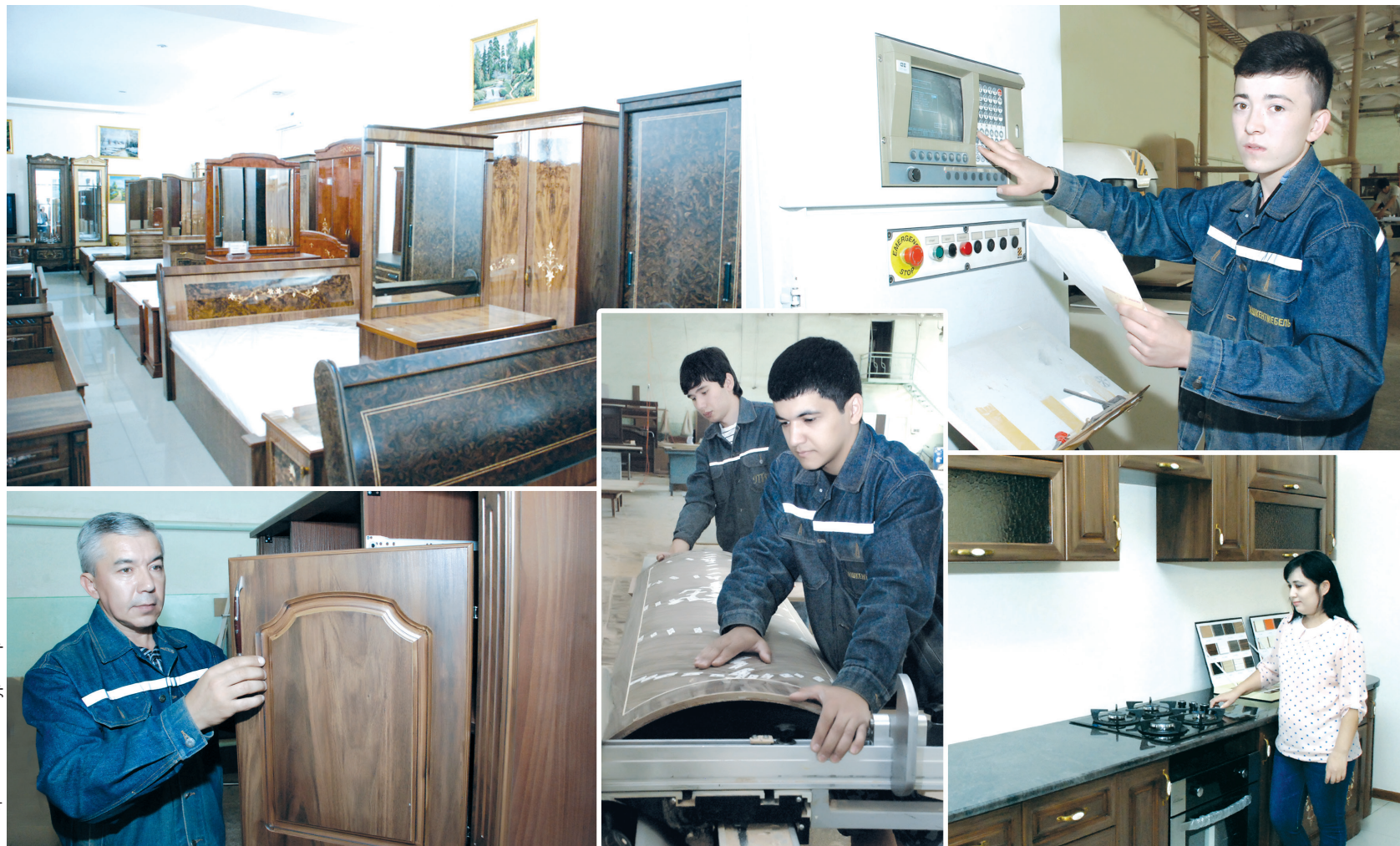
Солиқ, ЗОИР опан суратлар