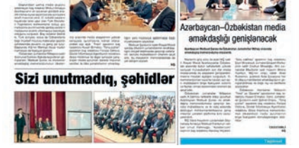
Ozab jurnalistlar "Xalq gazetesi"nda