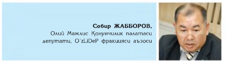
Собир ЖАББОРОВ, Олий Мажлис Қонунчилик палатаси депутати, O'zLiDeP фракцияси аъзосу

ПРЕЗИДЕНТИМИЗ ИСЛОМ ҚАРИМОВНИНГ «БОШ МАҚСАДИМИЗ — КЕНГ КЎЛАМЛИ ИСЛОХОТЛАР ВА МОДЕРНИЗАЦИЯ ЙЎЛИНИ ҚАТЪИЯТ БИЛАН ДАВОМ ЭТТИРИШ» НОМИЛИ МАЪРУЗАСИНИ ФРАКЦИЯМИЗ АЪЗОЛАРИ ҲАМ АТРОФЛИЧА ЎРГАНИБ, ТЕГИШЛИ ХУЛОСА ЧИҚАРДИЛАР