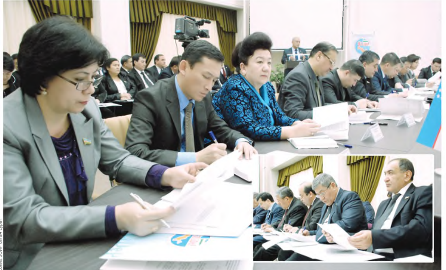
Сониқ ЭОИР олган сурат