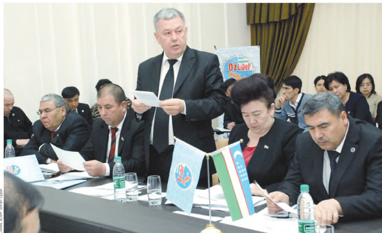
Солма ЗОИР, оғалин сураб

Жорий йилнинг 23-26 март кунлари пойтахтимиздаги Миллий санъат марказида анъанавий «Bazar-Art» кўرғазма-армаркаси бўлиб ўтади. «Ўзбекистон маданияти ва санъати форуми» жамғармаси томонидан «Ижод» рассомлар, санъатшунослар ва халқ усталари уюшмаси ҳамкорлигида ўн иккинчи мартаба ташкил этилган кўрғазмада мамлакатимизнинг барча ҳудудларидан келган 150 дан зиёд хунарманд-уста ва тadbиркорларнинг қатнашиши кўзда тутилмоқда. Йилдан-йилга қамрови кенгайиб бораётган ярмарка санъат ихлосмандларида катта қизиқиш уйғотиши табиий. Зеро, унда кўл меҳнати асосида яратилган турли буюм ва жиҳозлар, жумладан, ёрқин ранглардаги либослар, бежирим тақичоқлар, миллий нақшлар билан безатилган чинни идишлар, кўчирчоқлар, лойдан ишланган турли хайкалчалар, шунингдек, деворни картина ва гиламларни намойиш этиш режалаштирилган. Маълумотларга кўра, кўрғазмада ўзининг маҳсулотлари билан эл-юртга ва кенг жамоатчиликка танилган оилавий тadbиркорлар ҳам иштирок этишади.