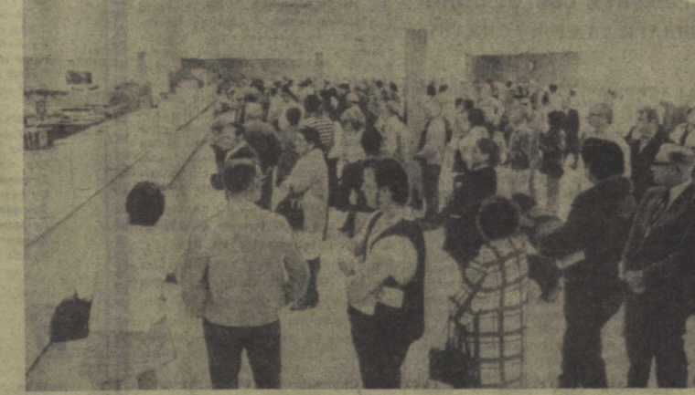
Оммавий ишсизлик Америка жамияти ҳаётидаги одатдаги бир воқеа бўлиб қолади. Ҳозирги кунда АҚШда 5 миллионга яқин ишсиз. Шулар орасида малакали ишчилар, собиқ ҳарбий хизматчилар, йирин олимлар ва инженерлар ҳам бор. Суратда: Сан-Хосе (Калифорния штати)да ишсизлар нафали олиш учун навбат кутиб туришди. Буларнинг орасида олий ўқу ёртини битириб чиқиб диплом олган ишчилар ҳам бор.

Биз тинчликни астойдил истаймиз. Аммо бу тинчлик чинакам мустақиллик, овозлик ва демократияга асослангани керак. Биз тинчлик ҳақида гапирганимизда Америка империализмининг қаҳрамон Вьетнам халқига инсоби, Вьетнам Демократик Республикасининг побхати Халқий шахрига инсоби қилоётган ва тарихда мисли қилолмаган жиноятларини қўриб қаҳр-ғазабимизни яшатушира омайди. Ҳозирги вақтда беш қитъа халқлари қаттиқ норозилик билдирмоқдалар. Биллар қарошлармиз, Хинди-Хитой ярим оролида биргаликда яшамоқдаимиз ва қарийб 30 йилдан бунён бир ёқдан бош чиқариб жанг қилоқдаимиз. Шу сабабли жуда қаттиқ норозилик билдирмоқдаимиз ва АҚШнинг жиноятларини кескин қоратиш ҳимоя қилоқ учун, овоз